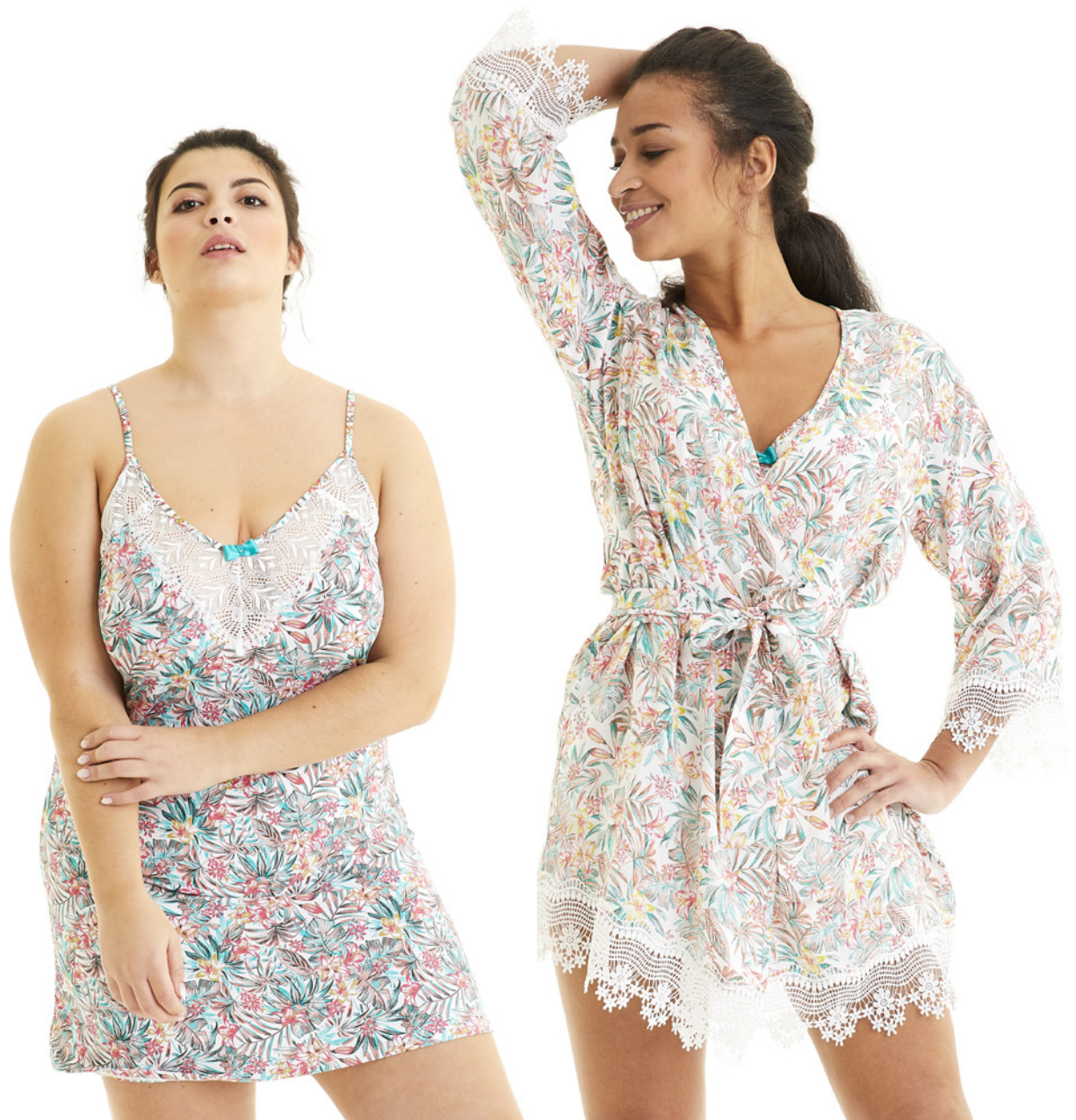
Nuisette - 38/40 > 46/48 - PVC 34,90€ | Kimono - 38/40 > 46/48 - 44,90€