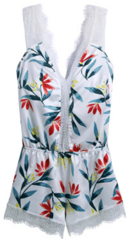
Combishort 34/36>46/48 - 40€