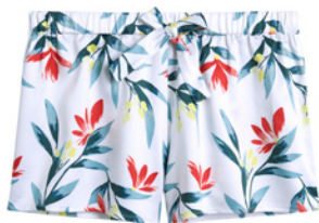
Top 34/36>46/48 - 25€ Short 34/36>46/48 - 24€