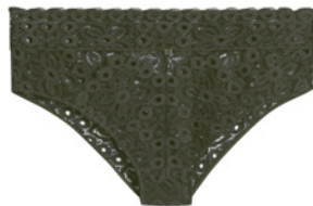
SG triangle 85A>90B - 44€ Culotte haute 38>46 - 30€