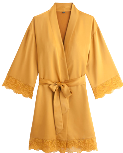
Kimono 38/40>46/48 - 42€