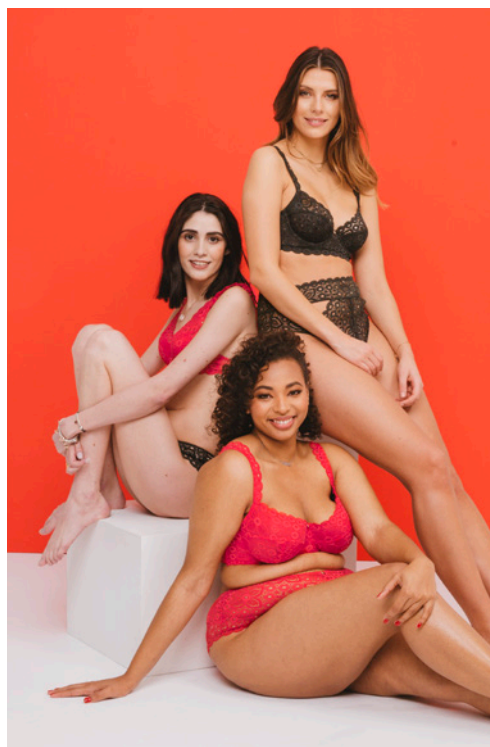
SG grand maintien 90E>105E - 45€ Culotte 38>48 - 27€