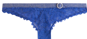
SG coque 85A>95D - 40€ Tanga 36>46 - 22€