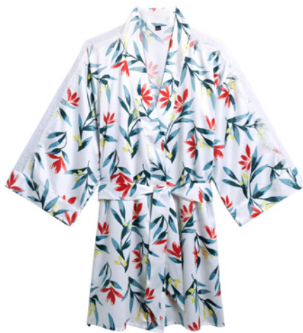
Kimono 38/40>46/48 - 40€