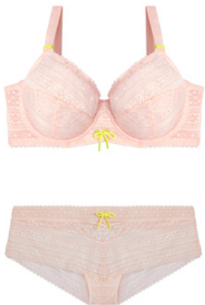
SG arma grand maintien 90E>105E - 39€ Shorty 38>48 - 24€