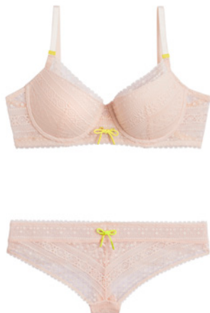
SG coque 85A>95D - 35€ Tanga 36>46 - 20€