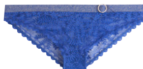
SG bandeau 85A>95B - 38€ Slip 38>48 - 20€