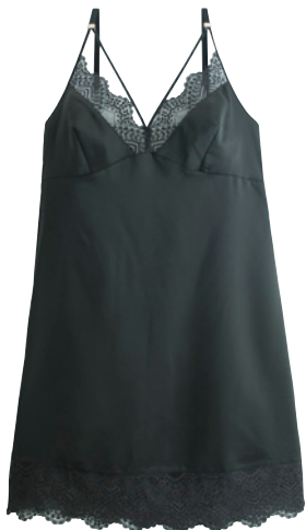
Nuisette 34/36>46/48 - 44€