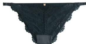
SG coque 85A>95D - 40€ Shorty 36>48 - 22€