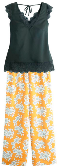
Pyjama 34/36>46/48 - 49€